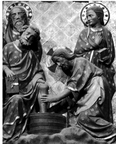
Notre-Dame de Paris

Wer andern die Füße wäscht, ist groß genug, demütig zu sein.